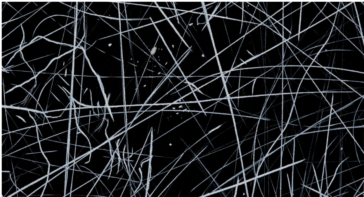
Karin Fleischer cuts, detail, engraving 2010