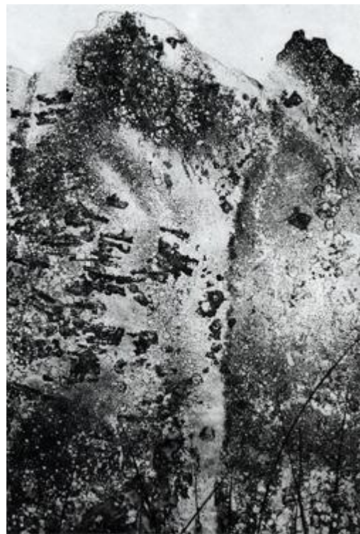
idea of rocks, 2010,detail; etching, engraving

Karin Fleischers Tiefdrucke und Zeichnungen entstanden als Gast des grosszügigen Cill Rialaig Retreats in Ballinskelligs Co.Kerry/Irland. Ihre kraftvollen Stiche und Carborundum-Radierungen beschwören die Dramatik der westlichsten Küsten Europas.