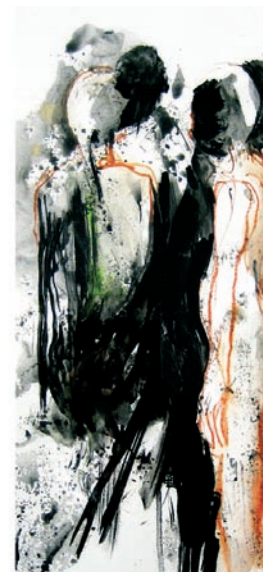
M. Reichelt, Auftritt, Mischtechnik auf Papier, 35,5 x 41,5 cm, 2009