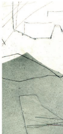
U. Krempel, „o.T.“, Monoprint, 39 x 25 cm, 2010