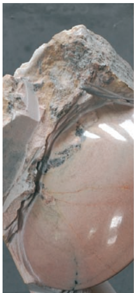
M. Ehmman, „Luna I“, Ind. Marmor, 2009