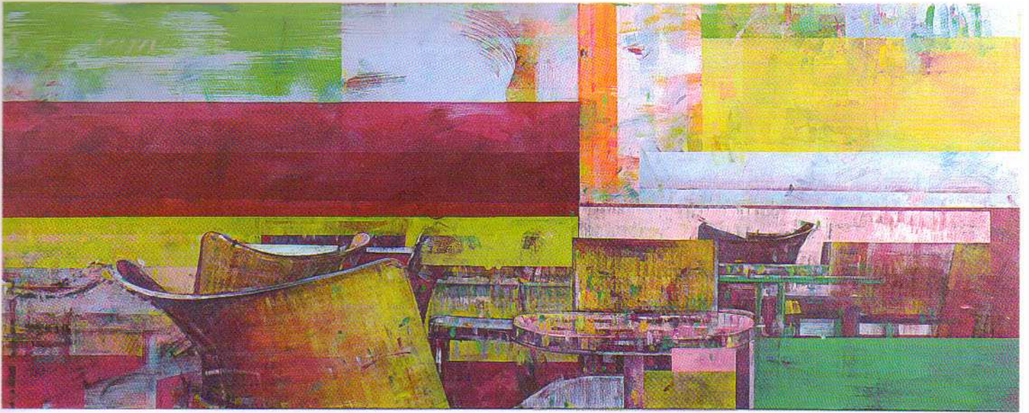
Dorothea Schutsch; Im Café 34 ; Acryl auf Nessel, 200 cm x 80 cm © Dorothea Schutsch

als die Umsetzung von Wahrnehmung und Atmosphäre.